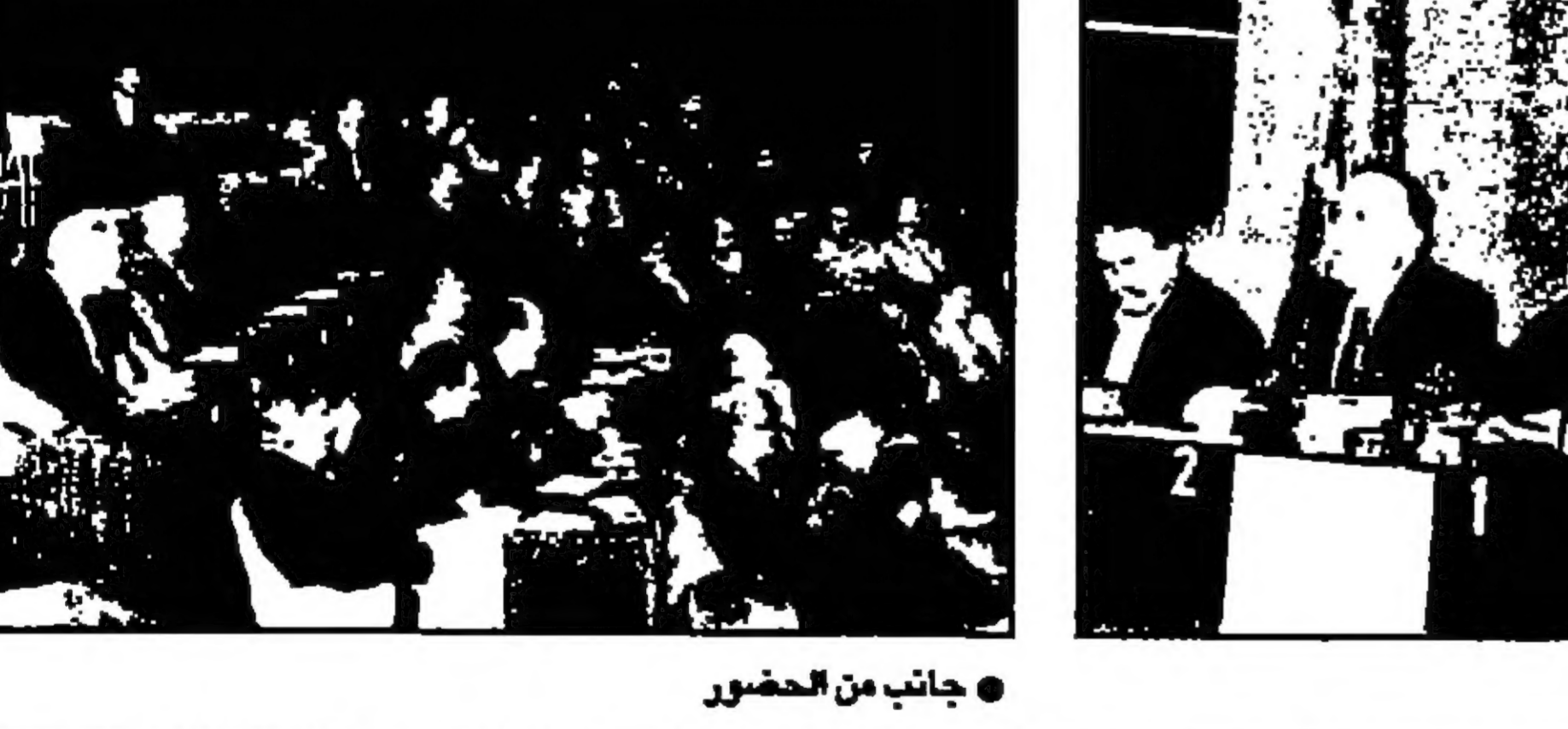
المشاركون في الندوة